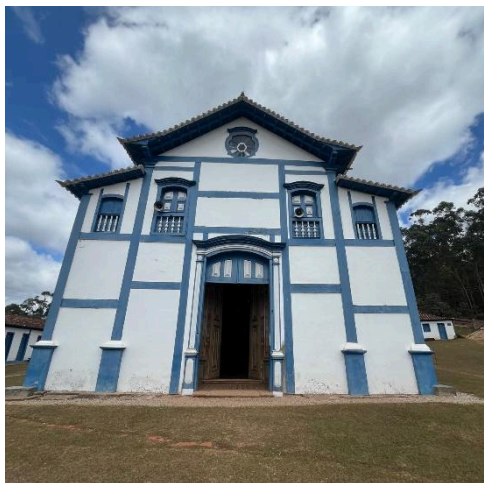
Mirante Santuário do Bom Jesus de Matosinho. Autoria: Eduardo Santos Data: 26/06/2025

O projeto tem como objetivo realizar a construção de um novo mirante para acolhimento do público das romarias, em um espaço já estabelecido e utilizado para tal finalidade, além de melhorias em seu entorno com a pavimentação da estrada ao seu redor e criação de vagas de estacionamento.