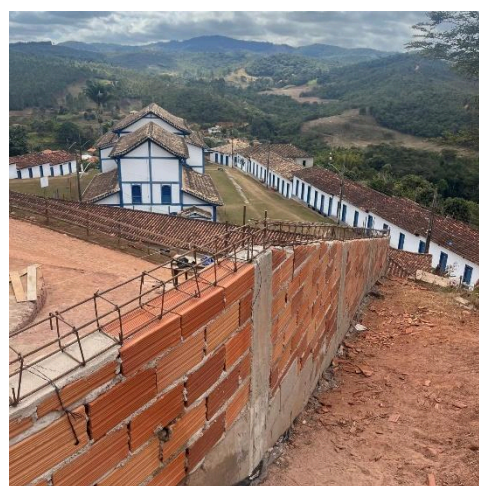
Placa da obra. Autoria: Eduardo Santos Data: 26/06/2025

Ao final da visita, constatou-se que as atividades do projeto estão sendo executadas conforme o cronograma previsto de forma satisfatória.