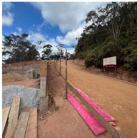
Mirante em construção. Autoria: Eduardo Santos Data: 26/06/2025